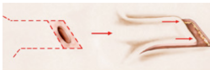
exemple de plastie locale : avancement d'un lambeau cutané

Dans les cas où la taille de la lésion ou sa localisation rendent irréalisable une fermeture par suture directe, la couverture de la zone retirée sera assurée soit par une greffe de peau prélevée sur une autre région, soit par une plastie locale qui correspond au déplacement d'un lambeau de peau avoisinant afin que celui-ci vienne recouvrir la perte de substance cutanée (cf schéma ci-après). La rançon cicatricielle de ce type de lambeau est bien sûr plus importante, mais, réalisé dans les règles de l'art, les résultats esthétiques à terme sont toutefois souvent meilleurs que ceux d'une greffe.